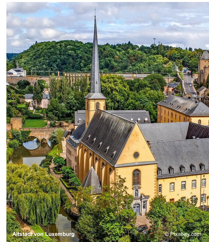
Altstadt von Luxemburg