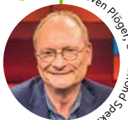
Sven Plöger